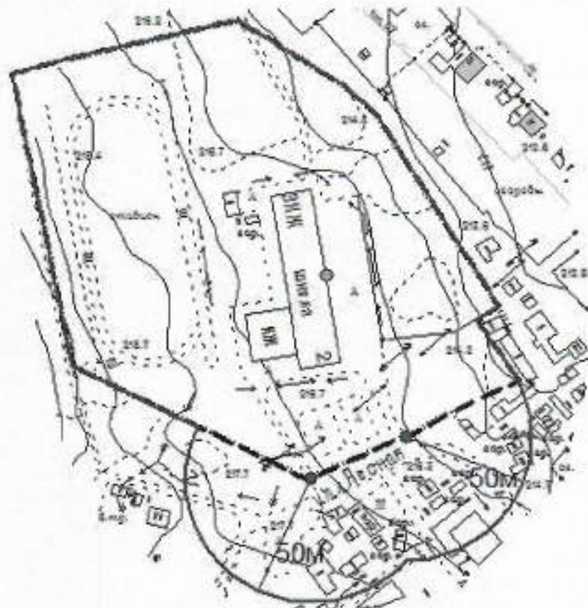
Схема границ прилегающих территорий, на которых не допускается розничная продажа алкогольной продукции, к Муниципальному автономному общеобразовательному учреждению «Средняя общеобразовательная школа № 2 имени летчика, дважды Героя Советского Союза Г.А. Речкалова» п. Бобровский, расположенному по адресу: Свердловская область, Сысертский район, поселок Бобровский, улица Лесная, 2

Приложение № 3 к постановлению Администрации Сысертского городского округа от 01.03.2019 № 346