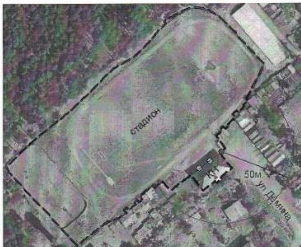
Схема границ прилегающих территорий, на которых не допускается розничная продажа алкогольной продукции, к Муниципальному казенному учреждению физической культуры и спорта «Искра», расположенному по адресу: Свердловская область, Сысертский район, поселок Бобровский, улица Демина, 10-а