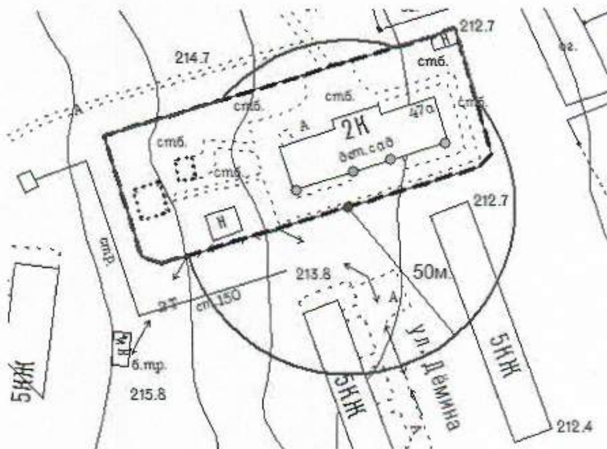
Схема границ прилегающих территорий, на которых не допускается розничная продажа алкогольной продукции, к Муниципальному автономному дошкольному образовательному учреждению «Детский сад общеразвивающего вида с приоритетным осуществлением деятельности по художественно-эстетическому развитию воспитанников № 60 «Дюймовочка», расположенному по адресу: Свердловская область, Сысертский район, поселок Бобровский, улица Демина, 47-а

Приложение № 6 к постановлению Администрации Сысертского городского округа от 01.03.2019 № 346