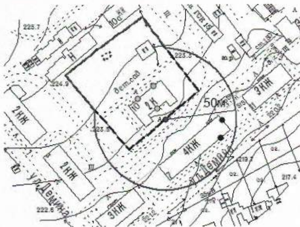
Схема границ прилегающих территорий, на которых не допускается розничная продажа алкогольной продукции, к Муниципальному автономному дошкольному общеобразовательному учреждению «Детский сад № 10 «Теремок», расположенному по адресу: Свердловская область, Сысертский район, поселок Бобровский, улица Демина, 10