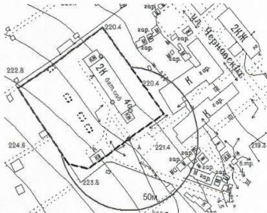
Схема границ прилегающих территорий, на которых не допускается розничная продажа алкогольной продукции, к Муниципальному автономному дошкольному образовательному учреждению «Детский сад № 29 «Василек», расположенному по адресу: Свердловская область, Сысертский район, поселок Бобровский, улица Чернавских, 4-а

Приложение № 7 к постановлению Администрации Сысертского городского округа от 01.03.2019 № 346