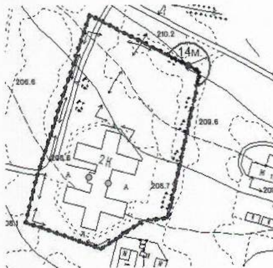
Схема границ прилегающих территорий, на которых не допускается розничная продажа алкогольной продукции, к Государственному бюджетному учреждению здравоохранения Свердловской области «Специализированный дом ребенка», расположенному по адресу: Свердловская область, Сысертский район, поселок Вьюхино

Приложение № 8 к постановлению Администрации Сысертского городского округа от 01.03.2019 № 346